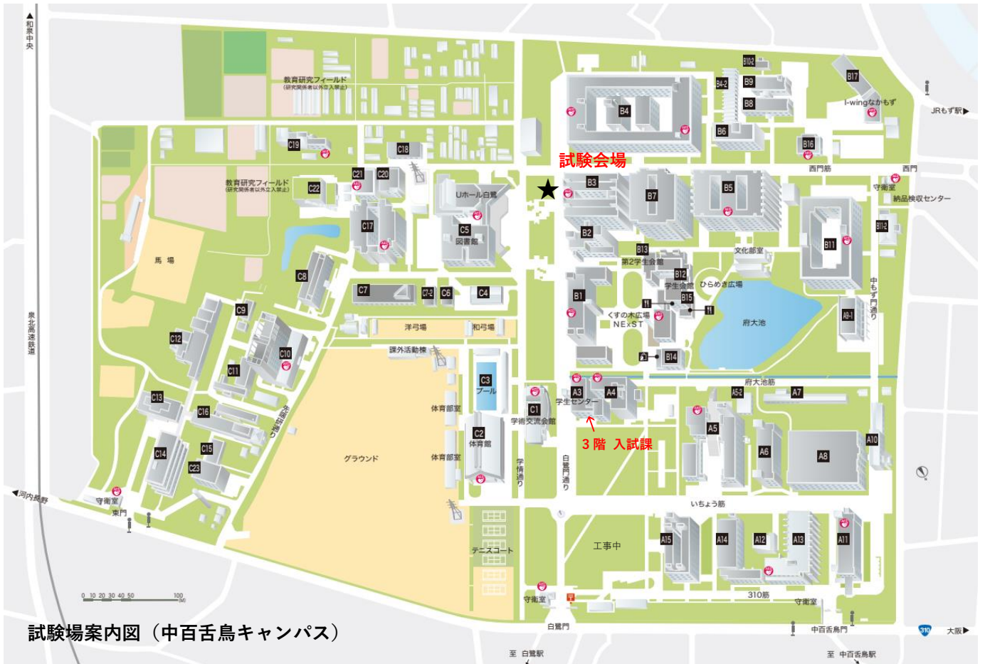
試験場案内図 (中百舌鳥キャンパス)