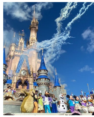
ディズニーワールド