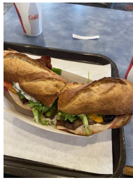
近所のサンドウィッチ