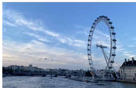
↑ テムズ川・ロンドンアイ