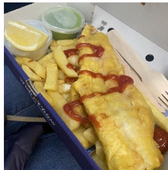
↑ フィッシュ&チップス