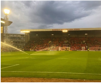
↑ サッカースタジアム