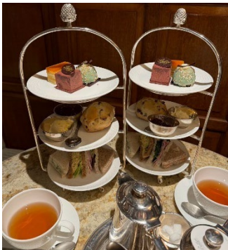
↑ アフタヌーンティー

また休日には大学のアクティビティとしてノッティンガムとヨークへの旅行に参加しました。他にもエディンバラ、スカボロー、プログラム前後にロンドンやパリ、ベルギーに旅行しました。イギリスには観光地がたくさんあり、折角の機会なので旅行することをおすすめします。どこに旅行しても美味しい料理や美しい景色をたくさん楽しめました！