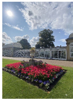
↑ Botanical Garden という公園/そこにいるリス