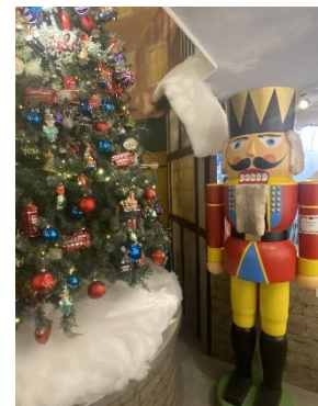
↑ クリスマスショップ