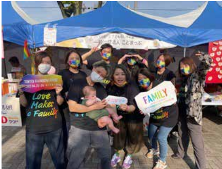
一般社団法人こどもまっふ