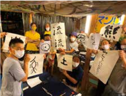
NPO法人ココルーム・釜ヶ崎芸術大学