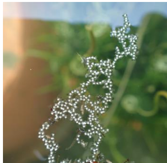
セキショウモの雄花

セキショウモはトチカガミ科の水生植物で、水中に沈んで生育します。陸上の植物は、風や虫が花粉を運んで受粉しますが、ネジレモは花粉をつけた雄花が水面を移動して受粉します。水草の変わった受粉方法を紹介します。