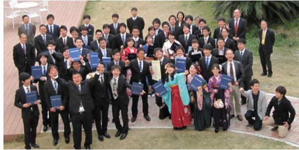
授与式後の集合写真

ここで、海洋での6年間で簡単に振り返ってみたいと思います。海洋での学生生活の始まりは、神戸のセミナーハウスでの学外合宿からでした。入学して数日後すぐにバスに乗って連れて行かれた山奥で、先輩方や先生方と一緒にドッジボールをして、ご飯を食べて、そして夜には新入生の第一関門である自己紹介タイムがあり、とても緊張したのを覚えています。さらにその2か月後には当時の海洋棟(A6棟)を貸し切った縦割りコンパもあり、この二大イベントを通じて同期や先輩、先生方と一気に距離が縮まったと思います。