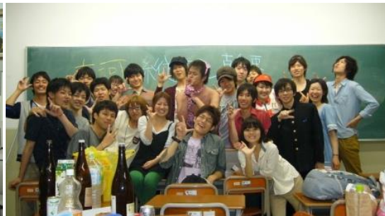
縦コン終了後の集合写真