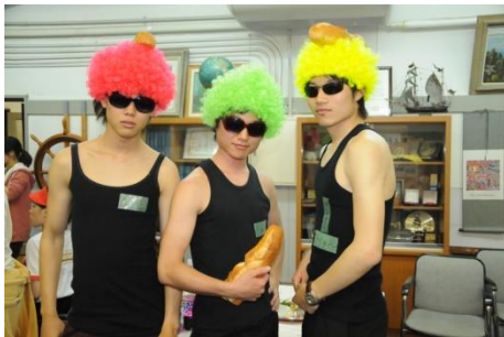
学年全員でコスプレ

この縦割りコンパも3年生になると、同期全員で幹事をするようになります。これまでは同じ授業を受けているだけの同期でしたが、このとき初めて全員が力を合わせて、集金から当日の運営までを分担して準備を行いました。そして当日は同期全員がコスプレをして運営するという初の試みもあり、大いに盛り上げる事ができました。