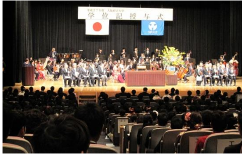
学位授与式の様子

2016年3月24日、29名の学部生と14名の大学院生が海洋を卒業しました。私にとって長いようであつという間の6年間でしたが、よき仲間とよき先生に出会えたこと、また素晴らしい環境で勉学と研究に取り組ませてもらえたことは本当に素晴らしい思い出です。