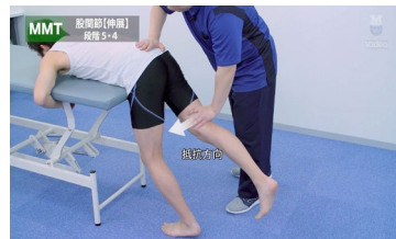
理学療法 physical therapy

メディカルオンラインビデオは医師や看護師、医療技術者、学生など、あらゆる医療関係者のための新しい医療動画配信サービスです。手術や各種手技など、多彩なラインアップで学生から医療従事者まで幅広い層にご利用いただけます。