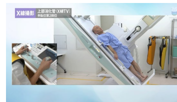
医用画像・診療放射線動画 Medical Imaging