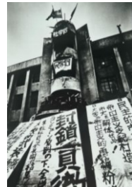
大学紛争時の3号館

大阪市立大学は米軍からの杉本学舎の全面返還、1960年以降の同窓生からの援助も加わった本格的な整備の後に大学紛争に巻き込まれ、その後も学生運動に悩まされます。この時期はどんな時期だったのか、皆さんと一緒に考えたいと思ひます。