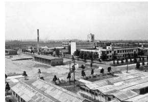
接収解除直後の1号館周辺

戦後直後、現在の杉本キャンパスは占領軍に接収され、「キャンプ・サカイ」あるいは「279th General Hospital」として転用されていました。その接収時の実態について、図面や写真を用いて解説します。