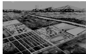
大阪商科大学杉本学舎完成予想図

近代の大阪は都市計画の先進地でした。そこではいち早く郊外型の大学キャンパスや、日本初の市立大学が誕生しました。この講演では大阪の都市計画が、我が国のキャンパスづくりに果たした歴史的役割を考えます。