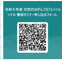
令和6年度 次世代のがんプロフェッショナル 養成セミナー申し込みフォーム