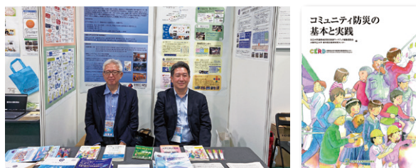
ぼうさいこくたい2022