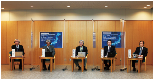
コミュニティ防災フォーラム2021