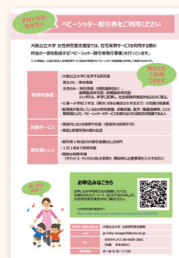
ベビーシッター割引券案内ポスター