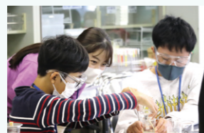
サイエンス・キャンパス