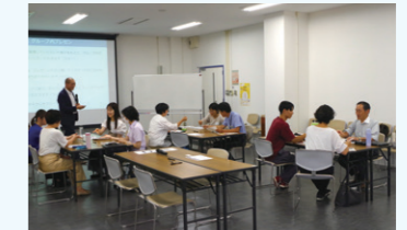
プレゼンテーション力向上セミナー