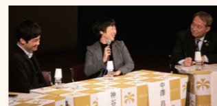
キックオフ・シンポジウム