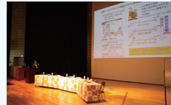
2023年度RESPECT共同研究助成報告会

本学の教授等の上位職における女性数増加を目的に、女性研究者に競争的インセンティブとして共同研究費を支援しています。女性研究者が研究チームのリーダーとなる活動促進を目指しています。