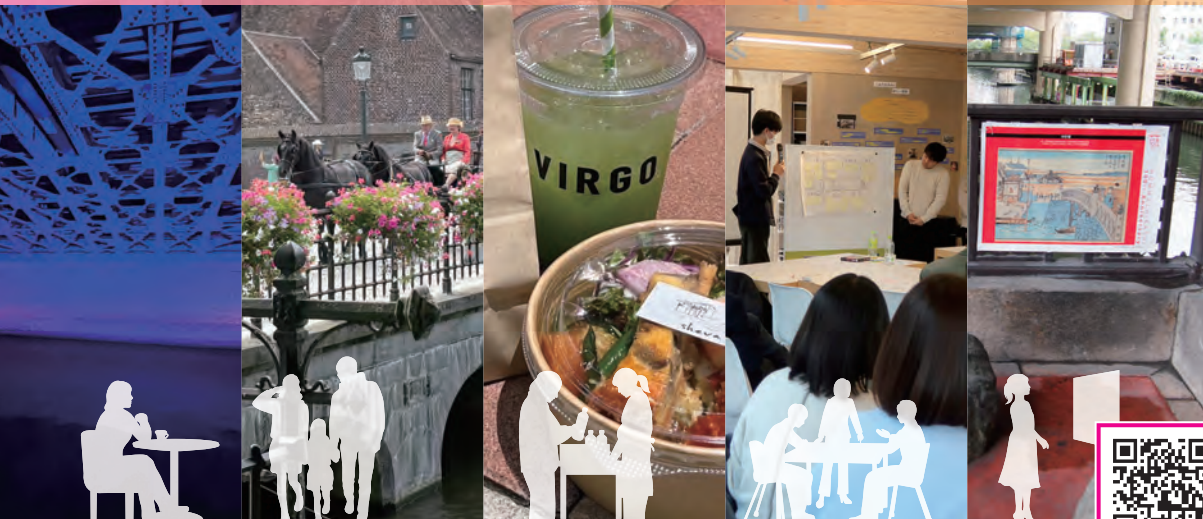
バルコニー等の活用